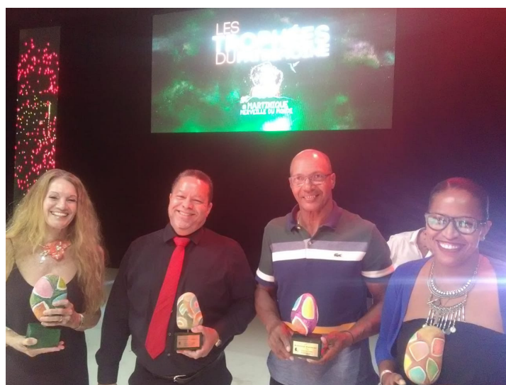
De G à D: Les représentants du SUAPS, lycée Nord Caraïbes, Aviron Club Frappez des Ailes et La Frégate

Cliquez sur les liens ci-dessous pour accéder aux articles en ligne de présentation du projet Aviron Scolaire Article France Antilles Martinique 1ere